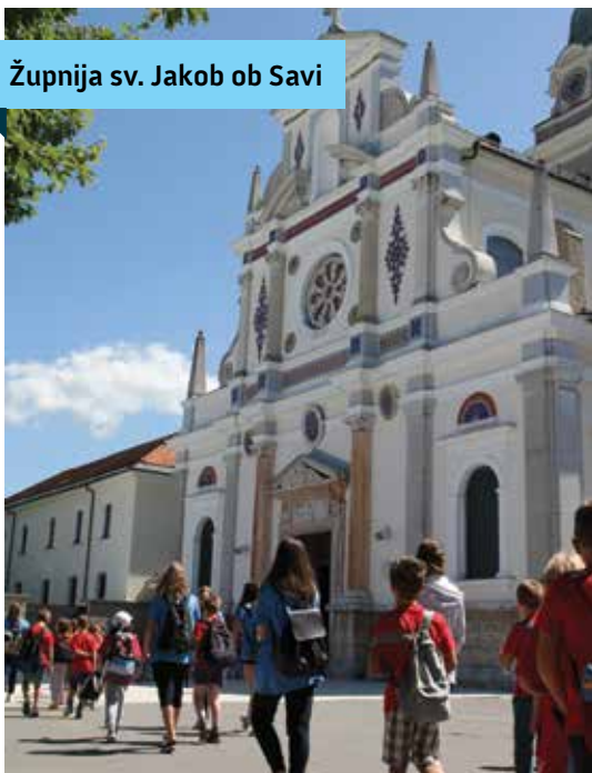
Župnija sv. Jakob ob Savi