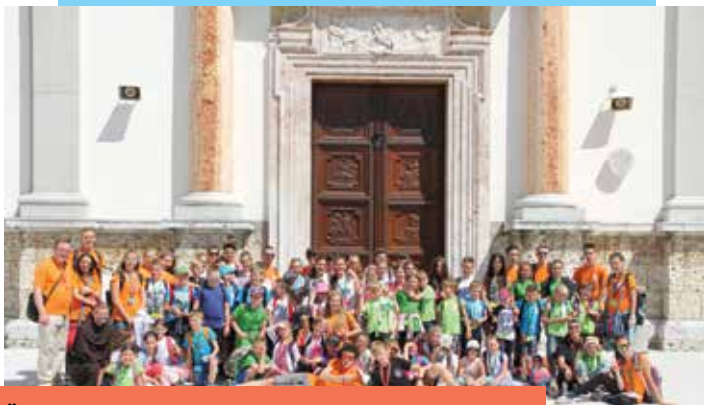
Župnija Kamnica in Sveti križ nad Mariborom