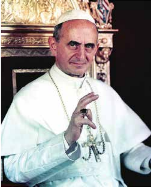
papež Pavel VI.